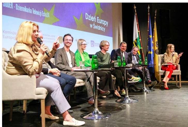
• Dzień Europy w Świdnicy