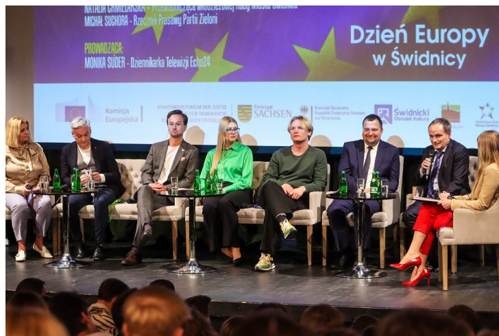
• Dzień Europy w Świdnicy