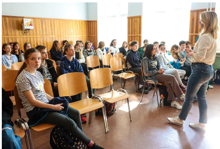
• Dzień Europy w Świdnicy

Dodał, że Unia stała się już tak oczywista jak oddychanie, tymczasem powinniśmy pamiętać, że wcale nie jest czymś oczywistym, w domyśle: danym raz na zawsze: – Kiedy o tym nie pamiętamy, to może się zdarzyć coś takiego jak brexit.