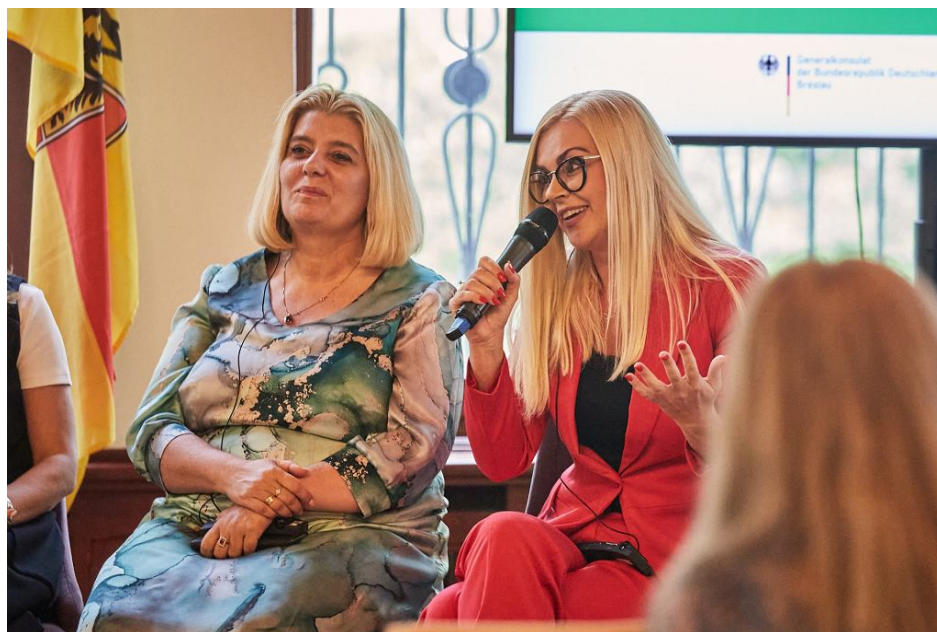
• Debata Kobiety w polityce lokalnej i regionalnej

decyzją, czy wejść w świat polityki i wziąć na siebie ciężar tej walki, czy będą potrafiły się z tym zmierzyć, czy to nie zniszczy ich osobowości, czy nie będzie miało wpływu na ich życie rodzinne. Trzeba być trochę żelazną, żeby funkcjonować w świecie polityki – stwierdziła prezydentka Świdnicy.