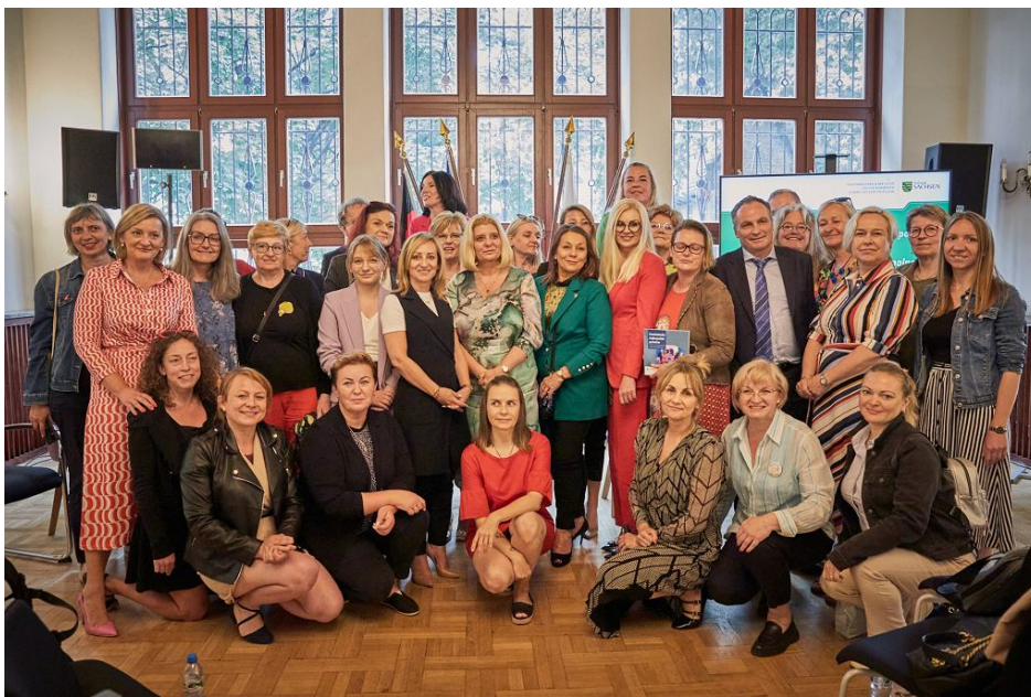
• Debata Kobiety w polityce lokalnej i regionalnej

W takim układzie poszczególne miejsca zajmowałyby na przemian mężczyźni i kobieta.